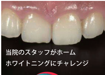
本院のスタッフがホーム ホワイトニングにチャレンジ

ホームホワイトニングは、ご自宅で「本を読みながら」 「テレビを見ながら」「就寝時」など好きな時間に出来るのが メリットです! 毎日やって頂くとより白さの変化がわかります。