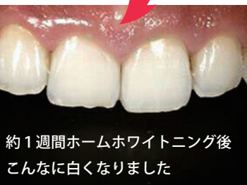
約1週間ホームホワイトニング後 こんなに白くなりました

加齢により表面のエナメル質も中の象牙質も黄ばみが強くなる 上に、肌同様うるおいがなくなり透明度が落ちてきます。 ぜひお得なキャンペーンのチャンスに、気軽に歯を白くして みませんか? きっと「やって良かった!」と感じて頂けるはず!